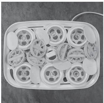
Afbeelding G. Plaatsing van brede onderdelen (spenen, ringen, doppen, ventdopjes)