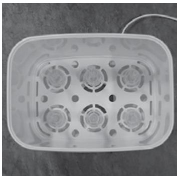
Afbeelding D. Plaatsing van brede ventpijpjes