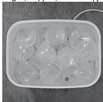
Afbeelding F. Plaatsing van brede afdekdoppen (2 doppen bodem, 4 doppen bovenop)