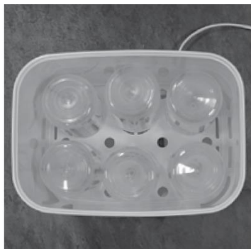
Afbeelding E. Plaatsing van brede flessen