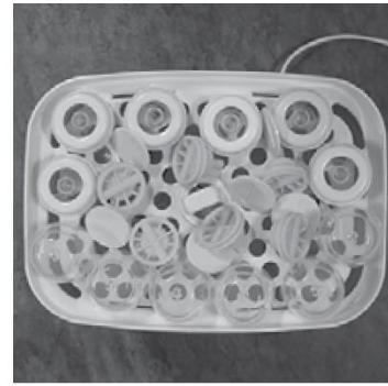
Afbeelding C. Plaatsing van smalle onderdelen (spenen, ringen, doppen, ventdopjes)