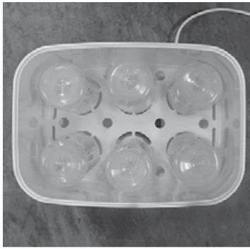
Afbeelding A. Plaatsing van smalle flessen