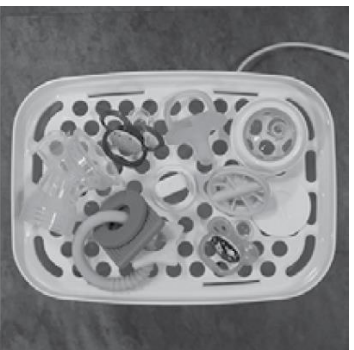
Afbeelding H. Plaatsing van fopsenen en bijtringen