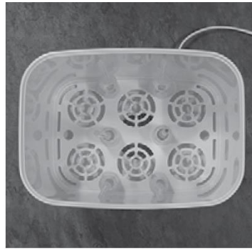
Afbeelding B. Plaatsing van smalle ventpijpjes